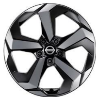
N-Connecta & Tekna 18" teemantlõikega valuvcljed (235/55 R18)