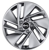
Acenta 17-tollised valuvcljed (215/65 R17)