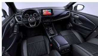
Tekna+ Sinine ja must, Monoform istmed, Premium nahas