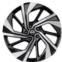
Tekna+ lisavarustus 20-tollised valuvcljed (235/45 R20)