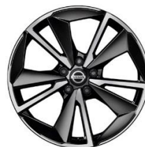
Tekna+ Lisavarustus Tekna varustusel 19-tollised valuvcljed (235/50 R19)