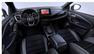
Tekna Sinine ja must - Monoform istmed, tekstiil ja sünteetiline nahk