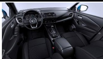
Visia & Acenta Must - Monoform istmed, tekstiil