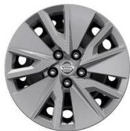
Visia 17-tollised terasveljed (215/65 R17)